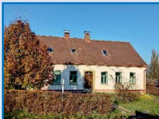
Hradiště u Nasavrk – okna, septik, komíny