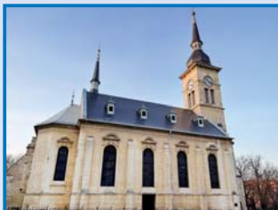
Žatec – oprava střechy