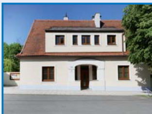
Javorník nad Veličkou – zateplení, okna