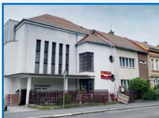
Teplice – oprava střechy