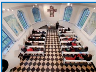
Strmilov – oprava interiéru kostela