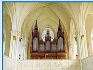
Krnov – oprava varhan