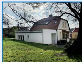
Litomyšl – přístavba fary