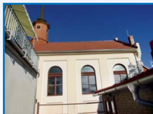
Hodonín – oprava střechy